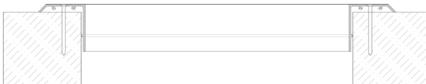
Габаритно-посадочные размеры регулируемой решетки РАГ-ВЦ+Р АхВ размеры строительного проема.

При стороне А > 500 мм устанавливается П-образный профиль 25х25 для жесткости изделия